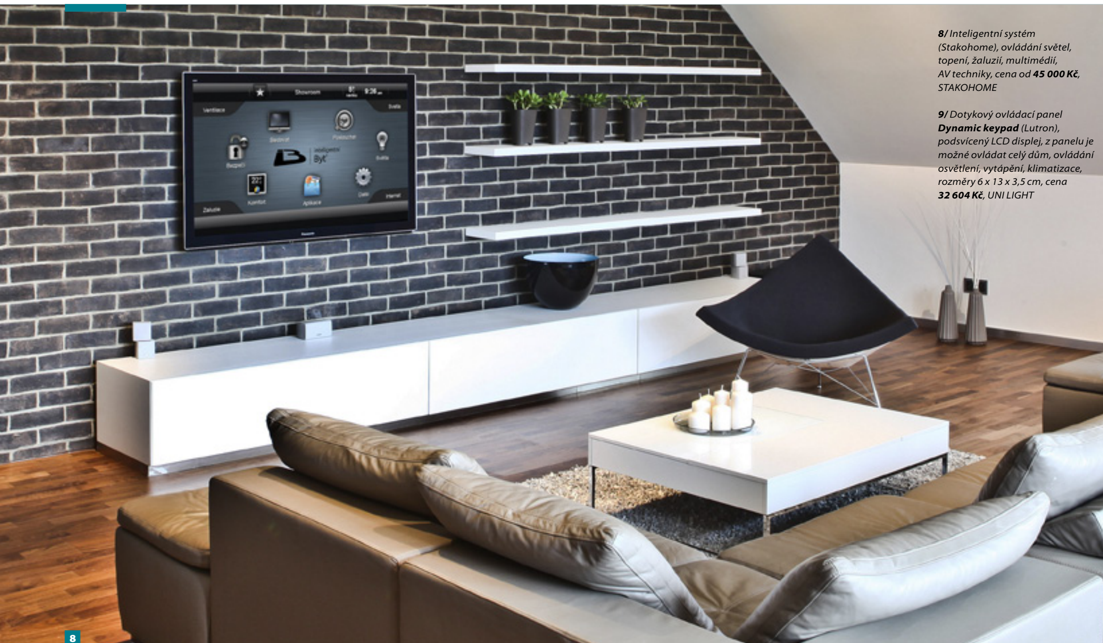
8/ Inteligentní systém (Stakohome), ovládání světel, topení, žaluzií, multimédií, AV techniky, cena od 45 000 Kč, STAKOHOMe