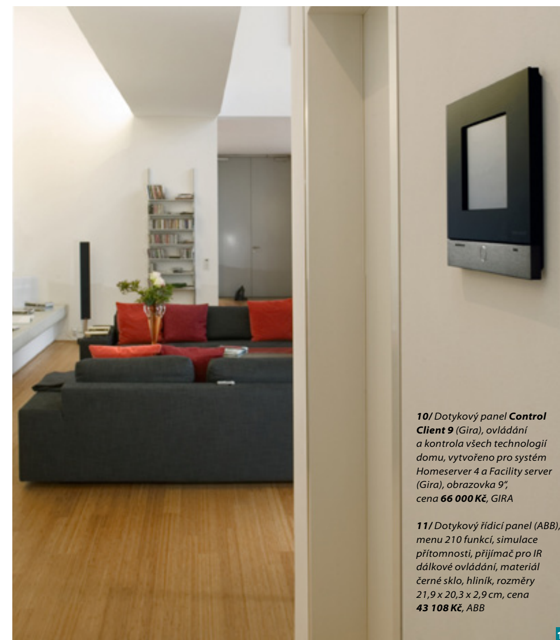
10/ Dotykový panel Control Client 9 (Gira), ovládání a kontrola všech technologií domu, vytvořeno pro systém Homeserver 4 a Facility server (Gira), obrazovka 9", cena 66 000 Kč, GIRA